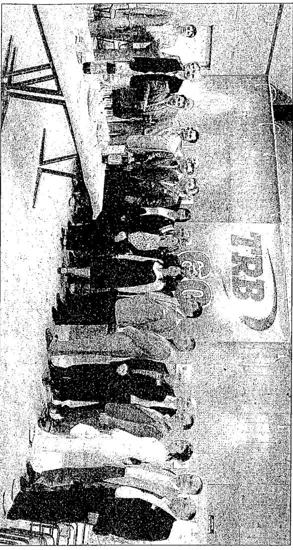
Parmi la délégation russe et ukrainienne reçue à Neslès, certaines entreprises étaient déjà clientes.

1 TRB est leader européen dans la fabrication de masses de bouchage.