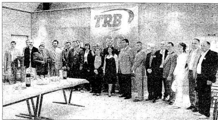
Parmi la délégation russe et ukrainienne reçue à Nesles, certaines entreprises étaient déjà clientes.